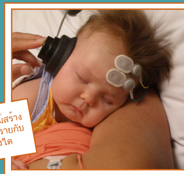
การตรวจวัดต่าง ๆ จะไม่สร้างความเจ็บปวดหรืออันตรายกับลูกของคุณแต่อย่างใด

เพราะการตรวจวัดส่วนใหญ่จะดำเนินการตอนที่ลูกของคุณกำลังหลับเนื่องจาก การเคลื่อนไหวตัวจะรบกวนการตรวจวัด