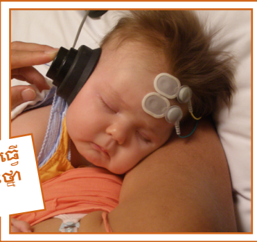
ការធ្វើតេស្តពុំមានធ្វើឱ្យទារកឈឺឬគ្រោះថ្នាក់អ្វីឡើយ។

អ្នកផ្នែកសោតវិទ្យារបស់អ្នកនឹងទូរស័ព្ទឬបញ្ជូនព័ត៌មានអំពីការរៀបចំទារកអ្នកយ៉ាងណាខ្លះសម្រាប់ការធ្វើតេស្ត។ ការរៀបចំទារកអ្នកនឹងជួយដល់ការធ្វើតេស្ត។ ទារកអ្នកត្រូវទៅដល់កន្លែងធ្វើតេស្តនោះក្នុងភាពនៅរលឹកប៉ុន្មានតែអស់កម្លាំងនិងរួចរាល់សម្រាប់គេង។ វាដូច្នោះដោយសារតែស្តុកភាគច្រើនគេធ្វើនៅពេលទារកគេងលក់ ព្រោះចលនាធ្វើឱ្យខានដល់ការវាស់។