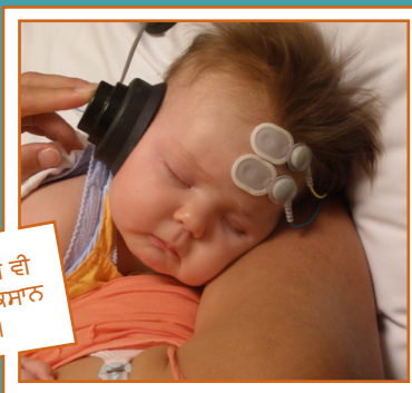
ਜਾਂਚਾਂ ਤੁਹਾਡੇ ਬੱਚੇ ਨੂੰ ਕਿਸੇ ਵੀ ਤਰੀਕੇ ਨਾਲ ਦੁਖੀ ਜਾਂ ਨੁਕਸਾਨ ਨਹੀਂ ਪਹੁੰਚਾਉਂਦੀਆਂ ਹਨ।

ਇਹ ਇਸ ਕਰਕੇ ਕਿਉਂਕਿ ਬਹੁਤੀਆਂ ਜਾਂਚਾਂ ਉਦੋਂ ਕੀਤੀਆਂ ਜਾਂਦੀਆਂ ਹਨ ਜਦੋਂ ਤੁਹਾਡਾ ਬੱਚਾ ਸੁੱਤਾ ਹੁੰਦਾ ਹੈ ਕਿਉਂਕਿ ਹਿੱਲਣ-ਜੁੱਲਣ ਜਾਂਚ ਵਿੱਚ ਵਿਘਨ ਪਾਉਂਦਾ ਹੈ।