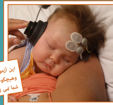
این آزمون ها دردآور نیست و هیچگونه صدمه ای به کودک شما نمی زند.

آماده کردن کودک تان به فرایند آزمون کمک می کند. لازم است وقتی که کودک شما به محل ملاقات وارد می شود بیدار باشد، ولی خسته و آماده به خواب رفتن. علت این موضوع این است که بیشتر آزمون ها زمانی انجام می شود که کودک تان در خواب است، زیرا حرکت کردن با آزمون تداخل پیدا می کند.